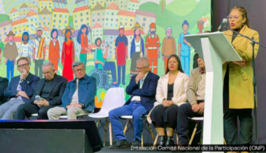
Instalación Comité Nacional de la Participación (CNP)

pueda tener un pensamiento político para buscar el cambio de Colombia y que no sea ni perseguido ni exterminado por esto. Este es un cambio político fuerte.