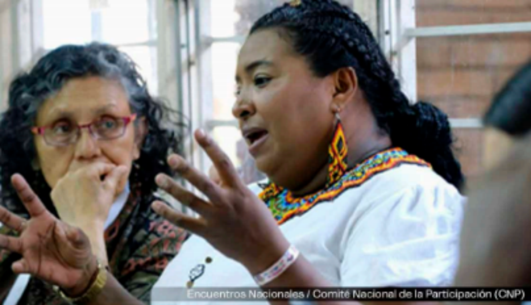
Encuentros Nacionales / Comité Nacional de la Participación (CNP)

La posición de el ELN frente al narcotráfico es: hay una Guerra fracasada contra las drogas que comenzó Nixon, en el año 72, que no ha hecho sino enriquecer los bancos, aumentar el consumo, aumentar el precio y aumentar los cultivos de coca, por ejemplo, en Colombia. Si fracasó, entonces, busquemos otra salida.